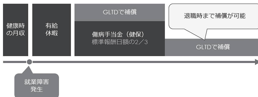
図表 GLTDの補償イメージ

以上のように、GLTDの導入は新規採用のみならず従業員の定着にも貢献することができますので、他社に先がけて導入することをお勧めします。